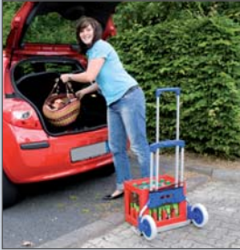
Piccolino-Familie: Die kleinen, praktischen Transportwunder für Freizeit, Hobby und Einkauf.

► Ein kurzes Drücken des Knopfes genügt, um den Holm herauszuziehen bzw. herunterzuschieben. Beim Klappen der Schaufel schwenken die Räder automatisch aus bzw. ein.