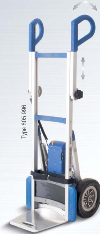
Type 805 996

Der starke Elektroantrieb wird durch einen aufladbaren Akku versorgt. Eine Akkuladung reicht für bis zu 30 Stockwerke.