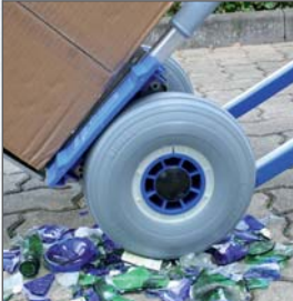
Das unplattbare AIRLEX-Rad Nr. 25 aus geschäumten Polyurethan hinterlässt keine Spuren auf Böden.