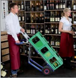
Type 2 212 21, mit Sicherheitshandgriffen und höhenverstellbarem Pendel inkl. Kunststoffhaken