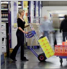
Die gewölbten, glasfaserverstärkten Querverbindungen tragen zur Stabilität der Stapelkarre bei.