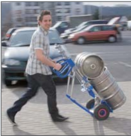
Type 243 212 21+1046 mit Aufnahmehaken zum cleveren Transport von KEG-Fässern