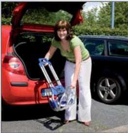
Mit einer Gesamtbreite von maximal 6 cm sind die schmalen Transportgeräte überall leicht verstaubar.